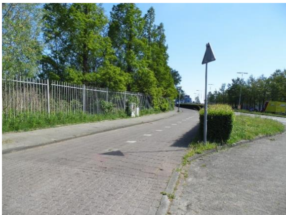
Het fietspad langs het Verkadeterrein