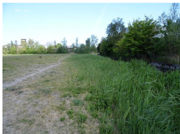
Plaats van de kleedkamers