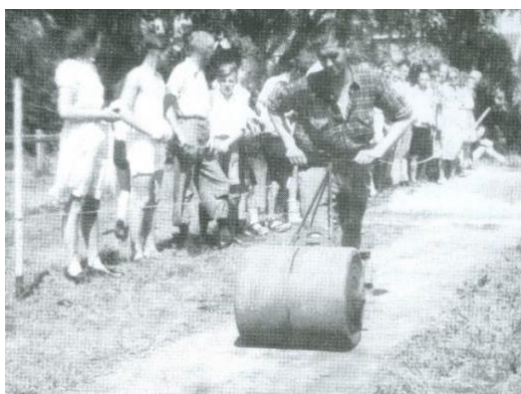
Gladwalsen van de aanloop